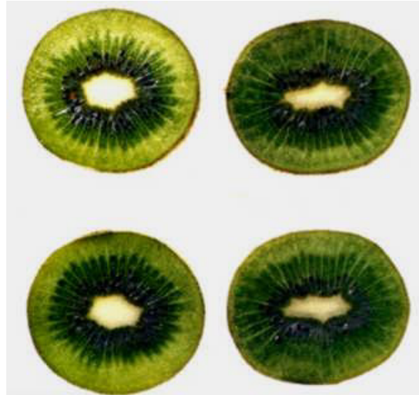
Erken hasat edilmiş kivi meyveleri

Henüz hızlı gelişme döneminde olduklarından yeterli irilik şekil ve ağırlığa ulaşmamışlardır. Karbonhidrat ve şeker birikimi, aroma maddeleri oluşumu geri kalır. Erken yapılan hasattan sonra depolama aşamasında, yeme olumuna yüksek kalitede ulaşamamakta, çok hızlı bir yumuşama, meyve eti sulanması ve renk bozulmaları görülmekte, özgün koku ve aroma oluşmamakta olup, depolama ömrünü kısaltmaktadır.