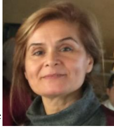
FIG RESEARCH INSTITUTE/AYDIN