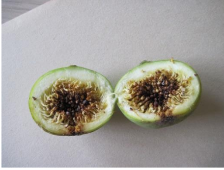
Hastalıklı boğa meyve oranı %30-57 (2005-2008 yılları)