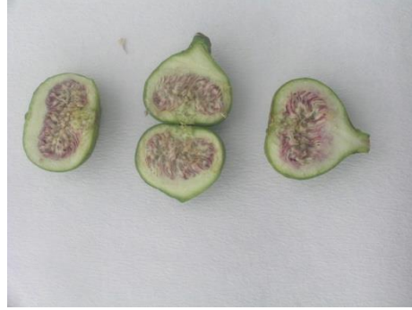
Sağlıklı boğa meyvesi görünümü