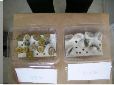
In vitro ve in vivo etkinlik denemelerinde Prochloraz'ın etkisi.