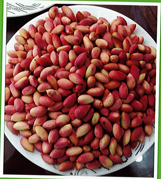
Piyasaya çıkan ilk turfanda antepfıstığı

Daha sonra ürün çoğaldıkça patakende fiyat 15 tl civarında seyretmiştir. Güneydoğu Anadolu bölgesinde ve çevre illerde yoğun olarak tüketimi gerçekleşmekte olup, Gaziantep Ticaret Borsası 2016 verilerine göre 2.500 ton civarında taze kırmızı kabuklu olarak işlem yapılmıştır. Akdeniz ve Ege bölgesinde ise az da olsa taze olarak tablolarda satış yapılmaktadır. Kalite ve verim arttıkça tanıtım yapılmak suretiyle taze tüketim artacak, çiftçilerimiz daha fazla gelir elde edeceğinden yaşam standardı yükselecektir..